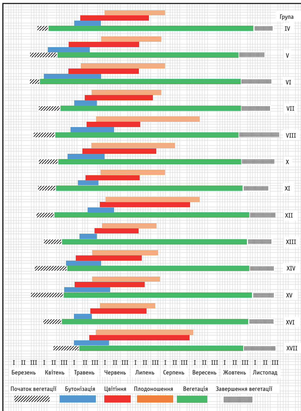
Рис. 1. Феноспектри сезонного розвитку сортів роду Heuchera різних груп: IV – жовто-зелені, V – світло-зелені, VI – зелені, VII – темно-зелені, VIII – жовто-коричневі, X – червоні, XI – червоно-коричневі, XII – коричневі, XIII – пурпурові, XIV – сіро-пурпурові, XV – сіро-зелені, XVI – сірі, XVII – темно-пурпурові

масового цвітіння розпочиналася через 47 діб у групі світло-зелені (V) і тривала 25 діб. Середня тривалість цього періоду в досліджених рослин Heuchera інших груп становила 69,7±16 діб. Середня тривалість періоду