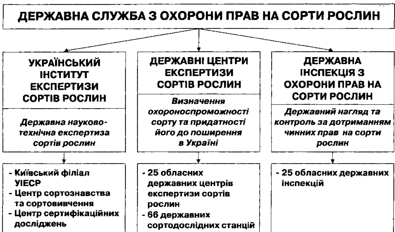
Рис.2. Державна система охорони прав на сорти рослин