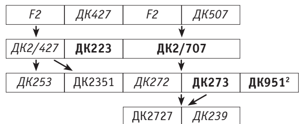
Рис. 2. Схема створення базових ліній кукурудзи в циклічних програмах кумулятивного добору

генотипів із різною тривалістю вегетації стало залучення модифікованого кумулятивного добору. Його зміст полягав не тільки в закладанні нового циклу добору на базі сібсів S4–S5, а й у використанні для цього полусібсів, які отримували паралельно зі споріднених селекційних комбінацій, та інколи додавалися генотипи іншого походження. Схему модифікованого кумулятивного добору наведено на рисунку 2. Саме такий багатоступінчатий циклічний добір із поступовим додаванням інших джерел дав змогу отримати скоростиглі лінії Рейд (SSS), умовно названі ДК273, ДК239 та ДК3821.